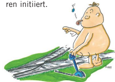
Abb. 1: Schritt 1: Entscheiden und organisieren.

Außerdem ist festgelegt, wie die Umsetzung des Aktionsplans überwacht, ggf. mit neuen Impulsen versehen wird und wer (welche Organisationseinheit) den nächsten CAF-Prozess in zwei bis drei Jahren initiiert.